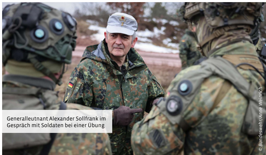
Generalleutnant Alexander Sollfrank im Gespräch mit Soldaten bei einer Übung

Die ARF ist defensiv ausgerichtet. Ihr Einsatz dient der Rückversicherung und Abschreckung, quasi als Stoppzeichen, dass ein kritischer Punkt erreicht ist. Die schnelle Verlegung ist dabei ein wesentlicher Bestandteil der Abschreckungsfähigkeit. Genau das wird aktuell bei Steadfast Dart als eine NATO-Schwerpunktübung geübt.