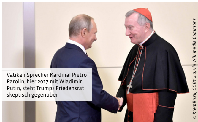
Vatikan-Sprecher Kardinal Pietro Parolin, hier 2017 mit Wladimir Putin, steht Trumps Friedensrat skeptisch gegenüber.

Obwohl Parolin anerkannte, dass jeder Versuch einer Antwort auf globale Krisen wichtig sei, wies er auf erhebliche „kritische Punkte“ bei der neuen Trumpschen Initiative hin. Die Hauptsorge des Vatikans gelte dabei der Autorität der bestehenden Weltordnungen, also den UN. Er forderte, dass die Vereinten Nationen das zentrale Organ für Friedensbemühungen bleiben müssten, anstatt diese Aufgaben an neue, weniger legitimierte Gremien auszulagern.