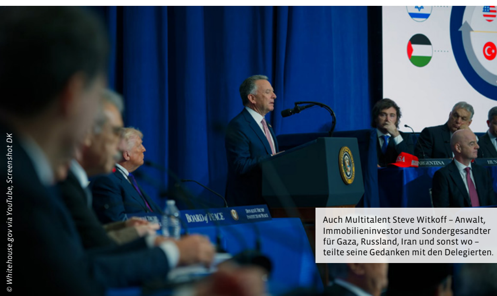
Auch Multitalent Steve Witkoff – Anwalt, Immobilieninvestor und Sondergesandter für Gaza, Russland, Iran und sonst wo – teilte seine Gedanken mit den Delegierten.

ein Paar. Sie sind sozial in der Not. Sie symbolisieren Freiheit, Macht und Stärke. Genauso, wie die amerikanischen Siedler in den Anfangszeiten der europäischen Besiedelung des nordamerikanischen Kontinents. Doch der Adler wurde durch Pestizide fast vollständig ausgerottet. Unterdessen jedoch haben sich durch massive Schutzmaßnahmen die Bestände erholt. Das Schicksal des US-Wappentieres ist ein Beispiel für das gesamte Land, für das es steht.