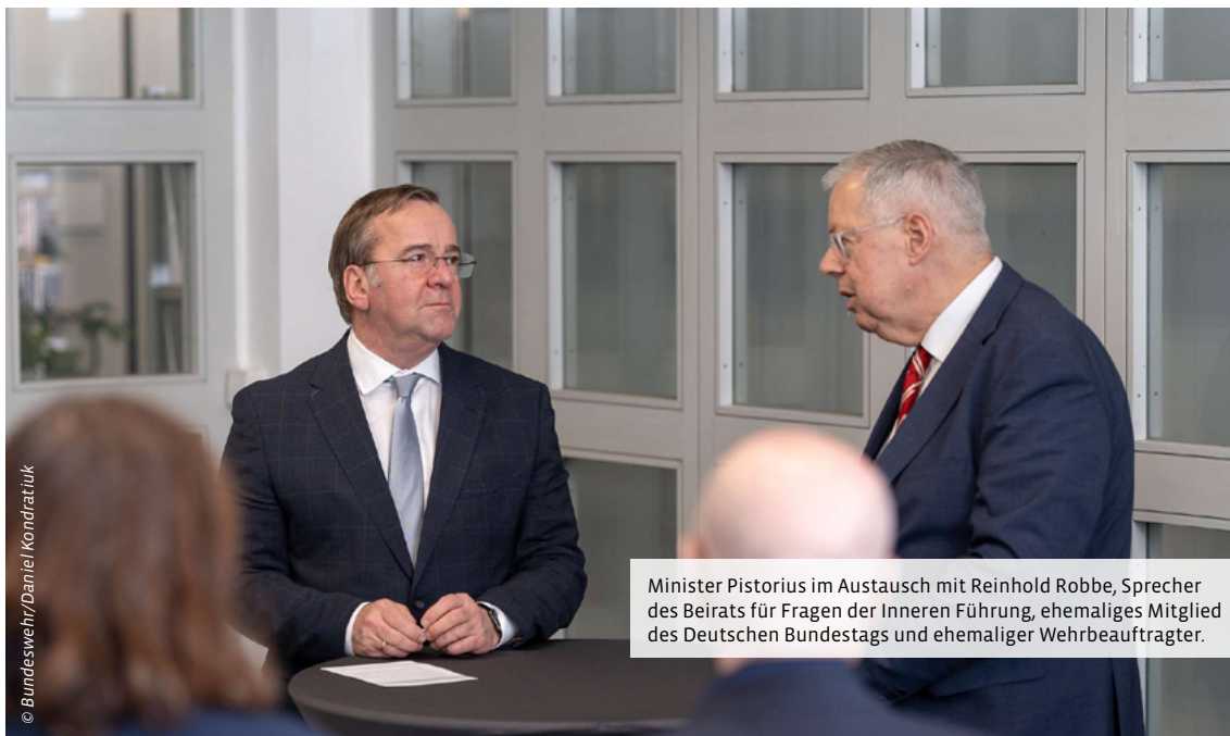
Minister Pistorius im Austausch mit Reinhold Robbe, Sprecher des Beirats für Fragen der Inneren Führung, ehemaliges Mitglied des Deutschen Bundestags und ehemaliger Wehrbeauftragter.

Als Seismograf für gesellschaftliche Erwartungen und als externe Impulsgeber beraten sie den Minister. Das Zusammentreffen aller Beteiligten am Zentrum demonstriert den engen Schulterschluss zwischen politischer Leitung, militärischer Führung sowie ziviler Expertise. Angesichts geopolitischer Instabilitäten, gesellschaftlicher Polarisierung und zunehmender Desinformation ist die gemeinsame Arbeit wichtiger denn je.