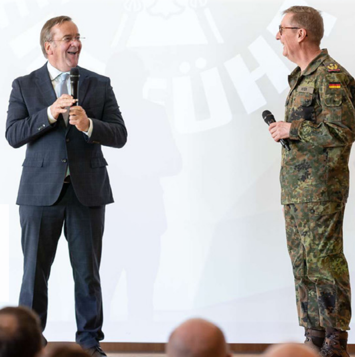
Minister Pistorius und Kommandeur Generalmajor Meyer sprechen über Innere Führung als Kern der persönlichen Einsatzbereitschaft der Soldatinnen und Soldaten der Bundeswehr.

Eine Brücke für die Bundeswehr in die Gesellschaft bildet der Beirat für Fragen der Inneren Führung. Vertreterinnen und Vertreter dieses unabhängigen Gremiums waren bei dem Termin zugegen. Die Expertinnen und Experten repräsentieren unter anderem Wissenschaft, Kirchen, Medien und Wirtschaft. Sie spiegeln zurück, wie das soldatische Selbstverständnis und die Ausrichtung der Truppe in der Bevölkerung wahrgenommen werden.