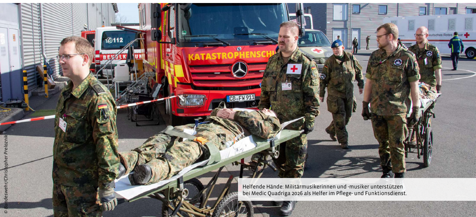
Helfende Hände: Militärmusikerinnen und -musiker unterstützen bei Medic Quadriga 2026 als Helfer im Pflege- und Funktionsdienst.