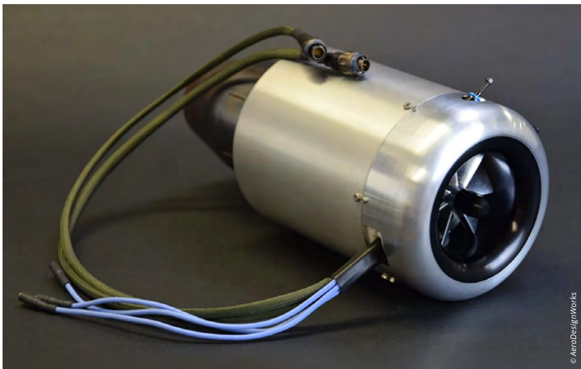
Kompetenzen „en Miniature“: Mit der Akquisition von AeroDesignWorks dringt MTU Aero Engines in einen Zukunftsmarkt vor, der z.B. mit einem solchen Turbojet mit integriertem Starter-Generator bedient werden kann.

Die umfassende Fertigungskompetenz der MTU ist dabei ein entscheidender Faktor. Ziel ist es, durch die sich ergänzenden Fähigkeiten von AeroDesignWorks und MTU einen führenden europäischen Anbieter für eine große Bandbreite militärischer Antriebssysteme zu schaffen.