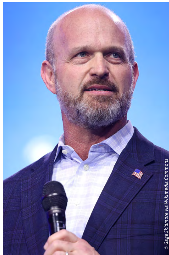
Kevin Roberts ist Präsident der Heritage Foundation, die als Basis des „Project 2025“ das „Mandate for Leadership“ herausgab, das vor der Wahl 2016 geschrieben wurde und 334 Empfehlungen enthielt. Auf Truth Social behauptete Donald Trump im Juli 2024, von „Project 2025“ nichts zu wissen.

Das „Project 2025“ ist in diesem Zusammenhang ein politischer Masterplan erzkonservativer Denkfabriken wie der Heritage Foundation. Deren Ziel ist es, den Einfluss der US-Bundesinstitutionen zu schwächen und die Macht der republikanischen Partei und ihres Präsidenten sowie die ihrer Unterstützer auszuweiten.