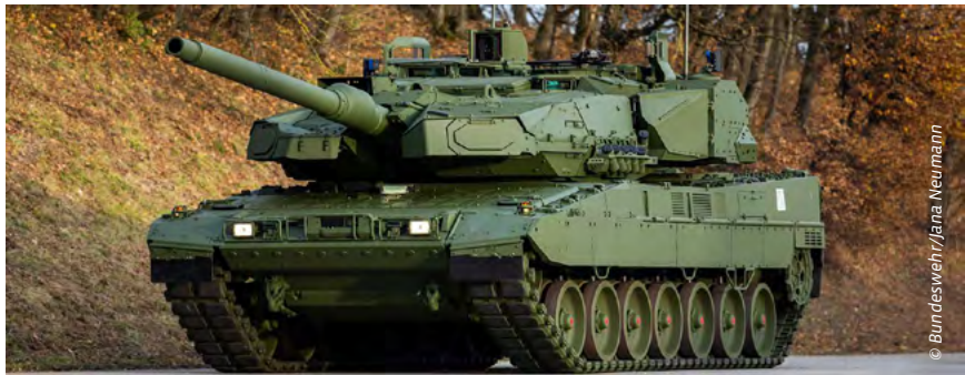
Die Beschaffung von neuen Kampfpanzern Leopard 2A8 ist eine weitere typische 25-Mio.-Euro-Vorlage