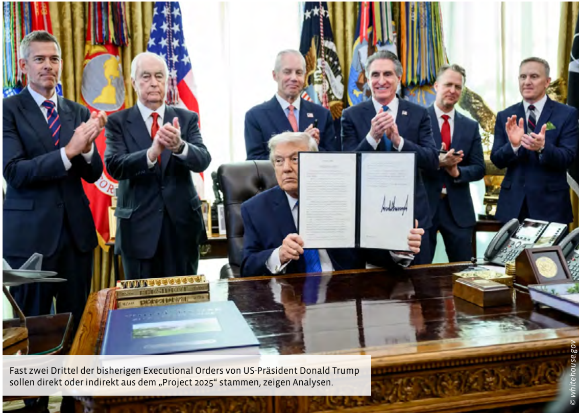
Fast zwei Drittel der bisherigen Executive Orders von US-Präsident Donald Trump sollen direkt oder indirekt aus dem „Project 2025“ stammen, zeigen Analysen.

Es geht der Trump-Regierung folglich mit dem „Project 2025“ nicht etwa um das Wohl des amerikanischen Volkes, sondern um Vorteile für die eigene politische Klientel. Das regt in den USA niemanden wirklich auf, da man es dort als durchaus normal empfindet, dass jede gesellschaftliche Gruppe für ihren eigenen Vorteil kämpft.