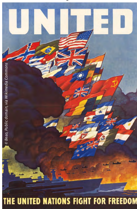
1945, im Jahr der Gründung der Vereinten Nationen, war die Organisation erfüllt von Zuversicht und Tatendrang. Das änderte sich jedoch mit den Jahren.

Das bedeutet, dass man in der Regel einen befähigten Mediator benötigt, um den kämpfenden Parteien einen für sie akzeptablen Weg zum Frieden zu eröffnen.