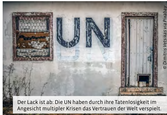
Der Lack ist ab: Die UN haben durch ihre Tatenlosigkeit im Angesicht multipler Krisen das Vertrauen der Welt verspielt.

Bei dieser Abstimmung haben jedoch die fünf ständigen Mitglieder (USA, China, Russland, Frankreich und das Vereinigte Königreich) ein Vetorecht. Wer der oder die nächste UN-Generalsekretär/in werden soll, ist derzeit noch vollkommen offen.