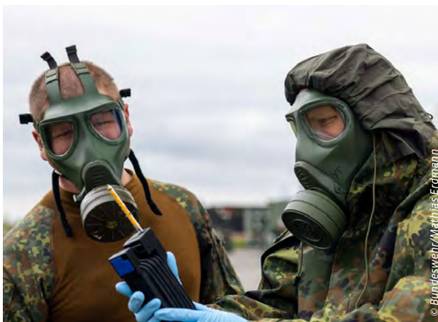
Zur 36-Stunden-Übung gehörte auch ein simulierter Unfall in einem nahen Chemiewerk, bei dem die Luft auf Schadstoffe geprüft werden musste, um entscheiden zu können, ob eine Evakuierung notwendig war.

Um den anonymen Fallakten während Vigorous Warrior 2026 ein Gesicht zu geben, standen 100 „Soldatinnen und Soldaten in darstellender Funktion“ zur Verfügung. Vier ausgebildete Schminkteams sowie unzählige helfende Hände gaben ihr Bestes, um von der Platzwunde bis zum offenen Schienbeinbruch jede Verletzung so realistisch wie möglich darzustellen. Darüber hinaus wurden künstliche Simulatoren genutzt, an denen auch realitätsgetreu operiert werden konnte. Sie simulierten von Atmung und Puls bis zur spritzenden perforierten Arterie alle Körperfunktionen, die auch ein echter Mensch besitzt. Auch alle inneren Organe sind für eine operative Intervention genau dort, wo sie sein sollen.