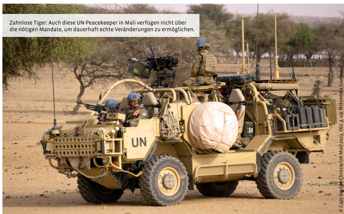
Zahnlose Tiger: Auch diese UN-Peacekeeper in Mali verfügen nicht über die nötigen Mandate, um dauerhaft echte Veränderungen zu ermöglichen.

Der Widerspruch zwischen Friedensforderung und einer Verletzung des Friedens durch die „großen Drei“ im Weltsicherheitsrat ist zwar nicht neu. Er wird uns jedoch heute einerseits in breiter Praxis und andererseits mehrfach sowie brutaler und anschaulicher denn je auf internationaler Bühne vorgeführt. Man muss nur die Augen öffnen, um dieses heute besonders weit verbreitete, höchst verwerfliche irdische Gewalt-Szenario als Ganzes erkennen zu können.